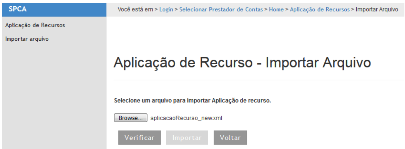
Figura 3 - Importar Aplicação de Recurso