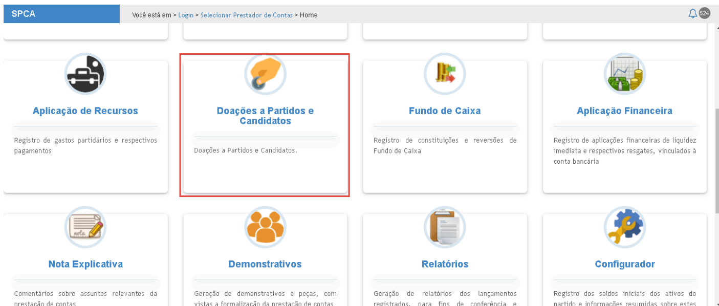
Figura 1 - Módulo de Doações a Partidos e Candidatos no SPCA Cadastro

Após acesso ao módulo, para visualizar os recursos correspondentes à importação de doação financeira a partidos e candidatos, o usuário deve acionar a opção "Importar Doações Financeiras" [A].