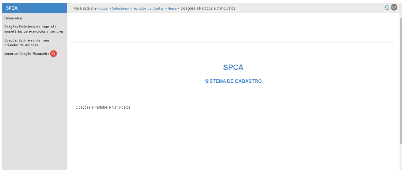
Figura 2 - Doações a Partidos e Candidatos - Importar Doação Financeira

Após acesso ao módulo, para visualizar os recursos correspondentes à importação de doação financeira a partidos e candidatos, o usuário deve acionar a opção "Importar Doações Financeiras" [A].